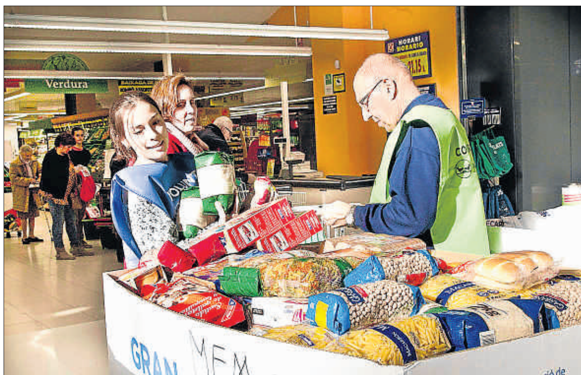
Recollida d'aliments ahir al mercat del Ninot a la campanya del Gran Recapte

MÉS INFORMACIÓ SOBRE EL GRAN RECAPTE A http://bit.ly/1PSrftw